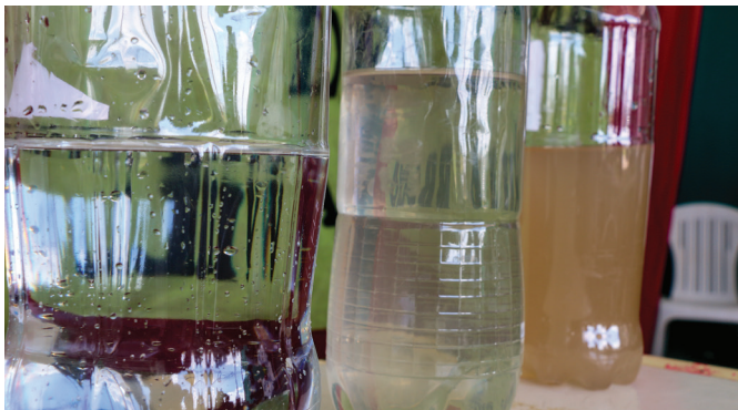
Diferencias entre agua de lluvia (izq), agua decantada (medio) y agua de canal (der)

En Santiago del Estero, existe un paraje llamado Villa Brana que queda a más 60 kilómetros de Quimilí, donde se ubica un Centro operativo de Cargill. Esa zona, alejada de servicios y comunicación, tiene al agua como protagonista de la problemática más visible. La comunidad educativa está formada por alumnos que desayunan y almuerzan, además de docentes que viven en la escuela y toman agua de un canal derivado del norte que usan también los animales. Desde allí, la gente junta el agua, la decanta y cocinan. Así confluyen dos temas centrales: salud e higiene.